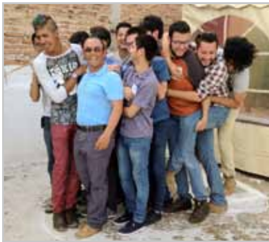
Grupo de encuentro de jóvenes diversos de Guanajuato.