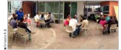
Taller sobre DDHH, VIH y diversidad sexual a prestadores de servicios

Nuestro agradecimiento a los y las adolescentes y jóvenes que han participado en este camino y a los siguientes aliados, con quienes construimos nuevas formas de SER.