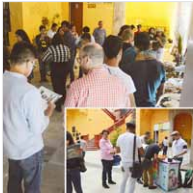
Inauguración de la 4to ciclo de cine de diversidad sexual en la UG.

Total de Beneficiarios 1,155 Proyecciones 21