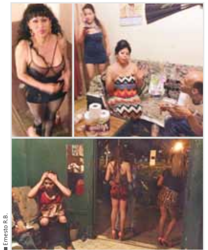
Intervenciones en zonas de trabajo sexual en León.

Total de Beneficiarios 1,632 Primera etapa