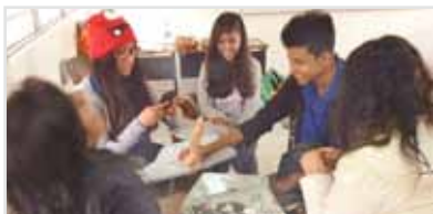
Taller de sexualidad con jóvenes preparatorianos.