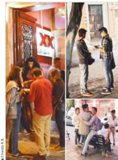
Brigadas con población de adolescentes y jóvenes gay y bisexuales.

Total de Beneficiarios 2,107 Apoyo económico 600,930