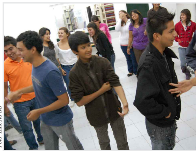
► Taller VIH/sida en la UDL campus Gto.

Las personas que se han involucrado en la ejecución de las acciones de Colectivo Seres, A.C., han participado del invaluable valor del SERvicio. Este proyecto es un proceso hecho por personas para las personas y que los cambios más profundos que buscamos surgen siempre de la comunidad. Las personas siempre han estado en el centro del nuestro análisis, y sobre todo de nuestras acciones.